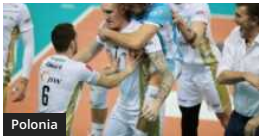
Polonia: Jastrzebski-Resovia 3-1 nel big-match. Exploit del Katowice contro il Warta Zawiercie