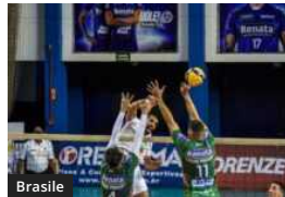
Brasile Brasile: Il Sada Cruzeiro vince il big-match anche senza Lopez