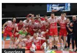
Superlega Coppa Italia: Piacenza più tonica conquista la F4. 3-1 a Modena che esce protestando con gli arbitri