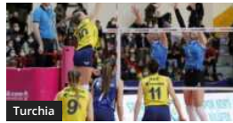
Turchia F.: Vincono Fenerbahce, Sariyer e a sorpresa Karayollari