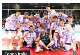
Coppa Italia Coppa Italia: Impresa Milano, vince a Civitanova 3-1. Prima storica volta alla F4