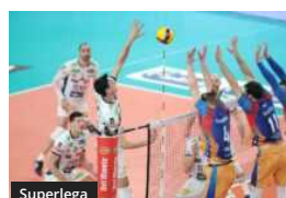
Superlega Coppa Italia: Troppa Trento per Monza, il 3-0 vale la 13ª Final Four consecutiva