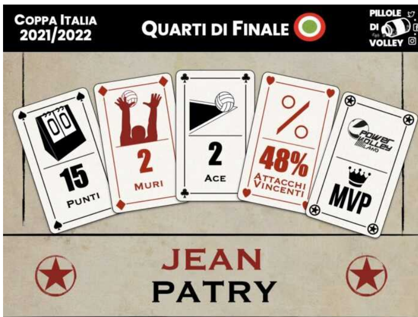
I numeri dell'opposto di Milano, miglior giocatore della gara contro la Lube.

Di Nicola Mazzoldi - 17 Gennaio 2022 👁 70